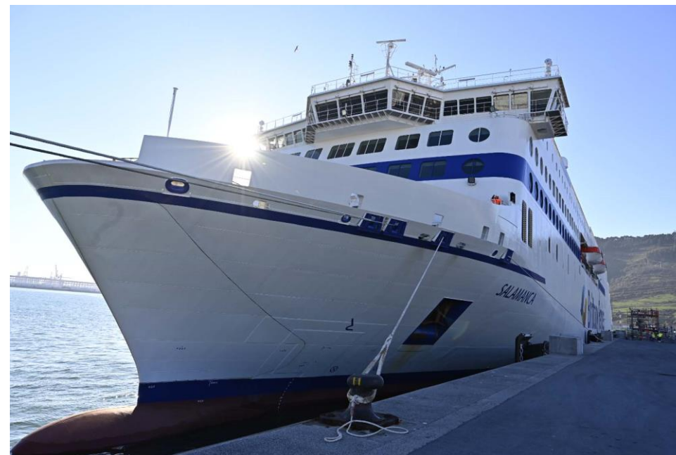
163 ferries a Reino Unido Irlanda (+14 barcos)