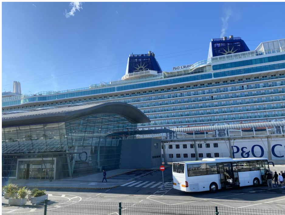
78 cruceros (+64 barcos)